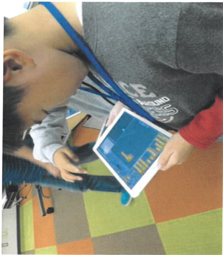
先に来た参加者はすぐにプログラミングを覚え、後から来た参加者に教えていました