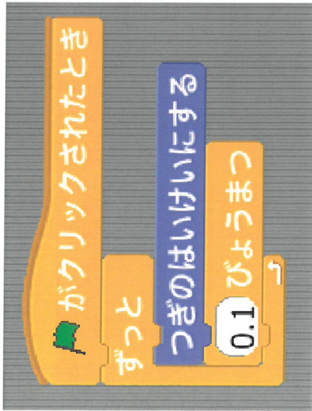
Scratchで作った じゃんけんプログラム