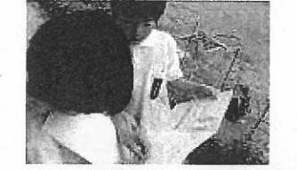
【「いいねシール」を貼って認め合う児童】