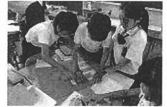
【任意単位を使って面積を比較する児童】