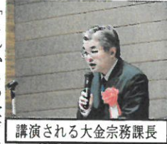
講演される大金宗務課長

二月十一日(土)、香川県教育文化研究所(香川教文研)と香川県小・中学校管理職員協議会(香管協)共催の平成二十八年度教育講演会が約二〇〇名の参加をいただき、香川県教育会館ミューズホールにて開催された。