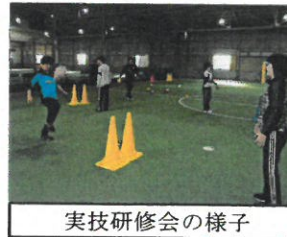
実技研修会の様子